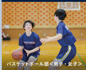
バスケットボール部 <男子・女子>